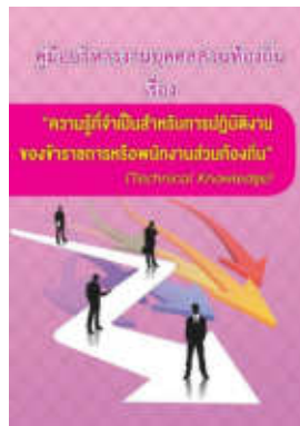
หนังสือ ความรู้ที่จำเป็นสำหรับการปฏิบัติงาน ของข้าราชการหรือพนักงานส่วนท้องถิ่น (Technical Knowledge)