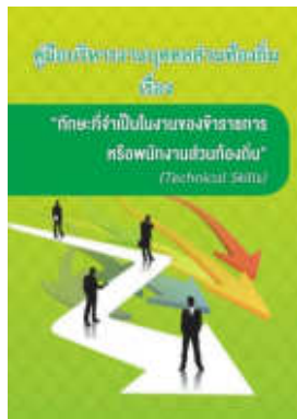
หนังสือ ทักษะที่จำเป็นในงานของข้าราชการ หรือพนักงานส่วนท้องถิ่น (Technical Skills)