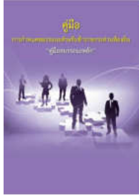
หนังสือ สมรรถนะหลัก