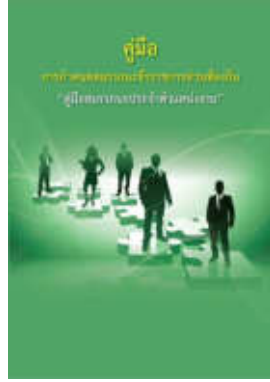
หนังสือ สมรรถนะประจำตำแหน่งงาน