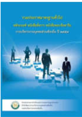
หนังสือ หลักเกณฑ์ หนังสือสั่งการ หนังสือตอบข้อหารือ การบริหารงานบุคคลส่วนท้องถิ่น ปี ๒๕๕๗