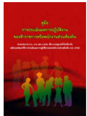
หนังสือ การประเมินผลการปฏิบัติงาน ของข้าราชการหรือพนักงานส่วนท้องถิ่น