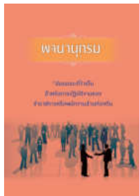
หนังสือ สมรรถนะที่จำเป็นสำหรับการปฏิบัติงานของ ข้าราชการหรือพนักงานส่วนท้องถิ่น