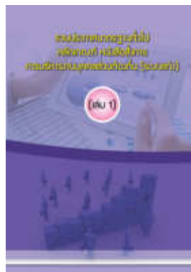
หนังสือ รวมประกาศมาตรฐานทั่วไป หลักเกณฑ์ หนังสือสั่งการ การบริหารงานบุคคลส่วนท้องถิ่น