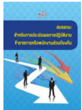
หนังสือ สมรรถนะสำหรับการประเมินผลการปฏิบัติงาน ข้าราชการหรือพนักงานส่วนท้องถิ่น