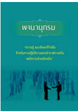
หนังสือ ความรู้ และทักษะที่จำเป็น สำหรับการปฏิบัติ งานของข้าราชการหรือพนักงานส่วนท้องถิ่น